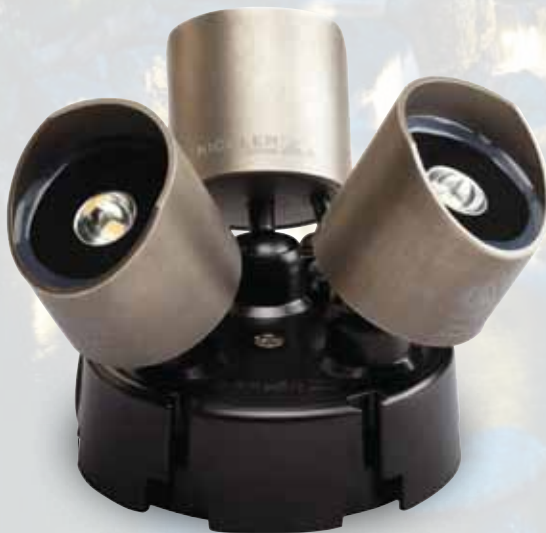
LP-U-15776-bk Verstellbarer Montageflansch mit Beschwerungsgewicht für bis zu 3 LED-Lampen (Lampe bitte separat bestellen)