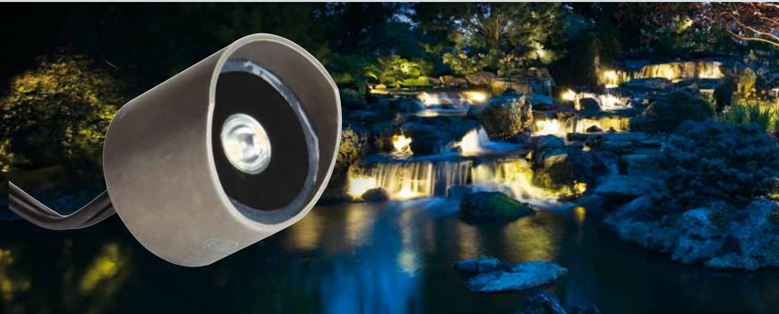
LP-U-15711-SS mit Blendschutz