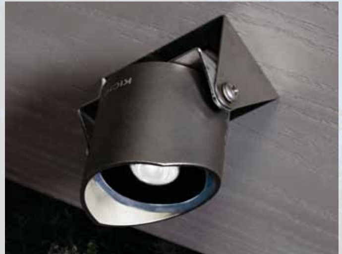
LP-ZM-15777-ss Verstellbarer Montageflansch aus Edelstahl (Lampe bitte separat bestellen)