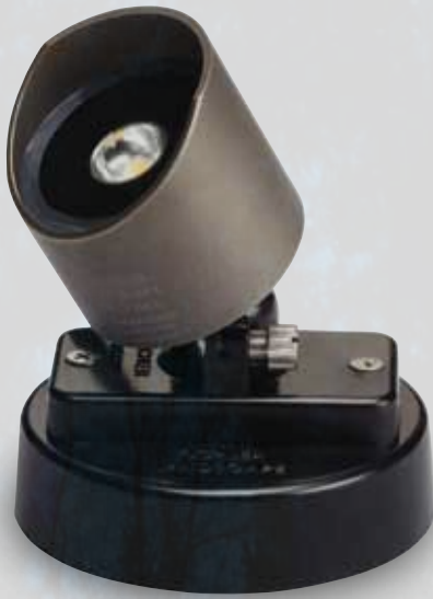
LP-U-15778-bk Verstellbarer Montageflansch mit Beschwerungsgewicht für 1 LED-Lampe (Lampe bitte separat bestellen)